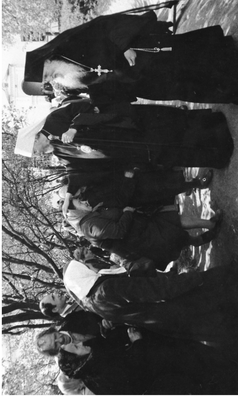
Митрополит Минский и Белорусский Антоний (Мельников) во время посещения Жировичского монастыря в сопровождении наместника архимандрита Константина (Хомича). Вторая пол. 1970-х гг.