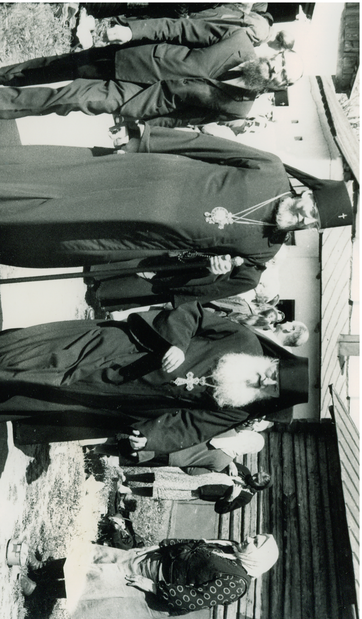
Архиепископ Минский и Белорусский Антоний (Мельников) во время посещения Жировичского монастыря в сопровождении наместника архимандрита Константина (Хомича). Первая пол. 1970-х гг.