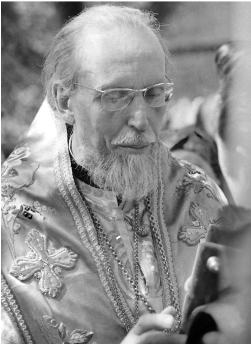
Митрополит Минский и Белорусский Антоний (Мельников)