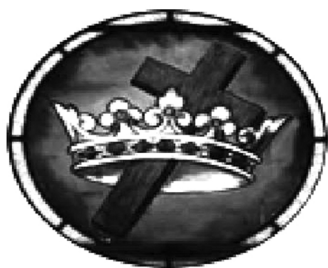
Логотип «Миссионерского движения мирян». Баптисты. 1909г.