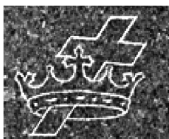
Кладбище «индиан Спринг» в США, погребение 1886 года.