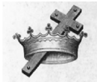
Последняя страница обложки брошюры напечатанной по поводу кончины Елены Уайт «Адвентисты». 1915г.