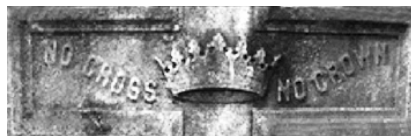
Кладбище Сэнт Мери. США штат Огайо Цинциннати. Погребение 1873 года.