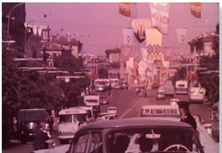
Украшение города к 900-летию Минска

При советской власти велась идеологическая работа по сплочению граждан всех республик, намеренно стирались все различия – каждый человек должен был чувствовать себя гражданином Советского Союза, а не жителем определённого села, города, области и республики. В свете такой идеологии праздник День города как ежегодное мероприятие не мог быть инициирован властями. Было два исключения из правила: празднование 800-летия Москвы в 1947 году и 900-летия Минска в 1967 году. В честь этих двух городов были устроены масштабные празднования. В ознаменование 800-летия Москвы Указом Президиума Верховного Совета СССР от 20 сентября 1947 года была учреждена медаль «В память 800-летия Москвы», которой были награждены около 1,7 миллиона человек. К Дню города Минска вся столица была украшена праздничными вывесками и растяжками, предприятия выпустили приуроченные к юбилею сорта пива, наборы конфет и шоколада, на Центральной площади был устроен концерт, а в одном из городских парков был организован хор вод сказочных персонажей вокруг костра.