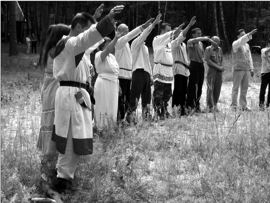
Рис. 2. Ритуал Дожинок на Славянском вече в 2004 году под г. Кобрином. Жест сопровождается возгласом: «Слава богам и роду нашему».

1. Все они имеют русскую (иногда обозначаемую как славянскую) националистическую направленность, выражающуюся в следующем: а) в текстах отмечаются факты целенаправленного уничтожения белой расы, русского (славянского) народа или отдельных лиц славянской национальности; б) призывается защитить белую расу, русский (славянский) народ или отдельных лиц славянской национальности или представителей националистических движений; в) отмечается плачевное состояние русского (славянского) народа; г) обвиняются религиозные (в основном ислам, иудаизм и христианство, называемое иудо-христианством) и социальные институты (банки, органы власти, общественные организации, наука, культура), на которые оказывают влияние «цветные» или «темные» народности или отдельные политические деятели (в основном евреи, кавказцы и мусульмане); г) высказывается критика, часто уничижительная, мировоззрения христи-